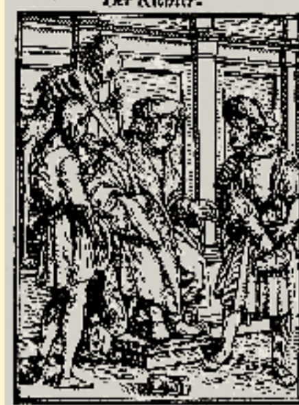
Allgegenwärtig – der Tod