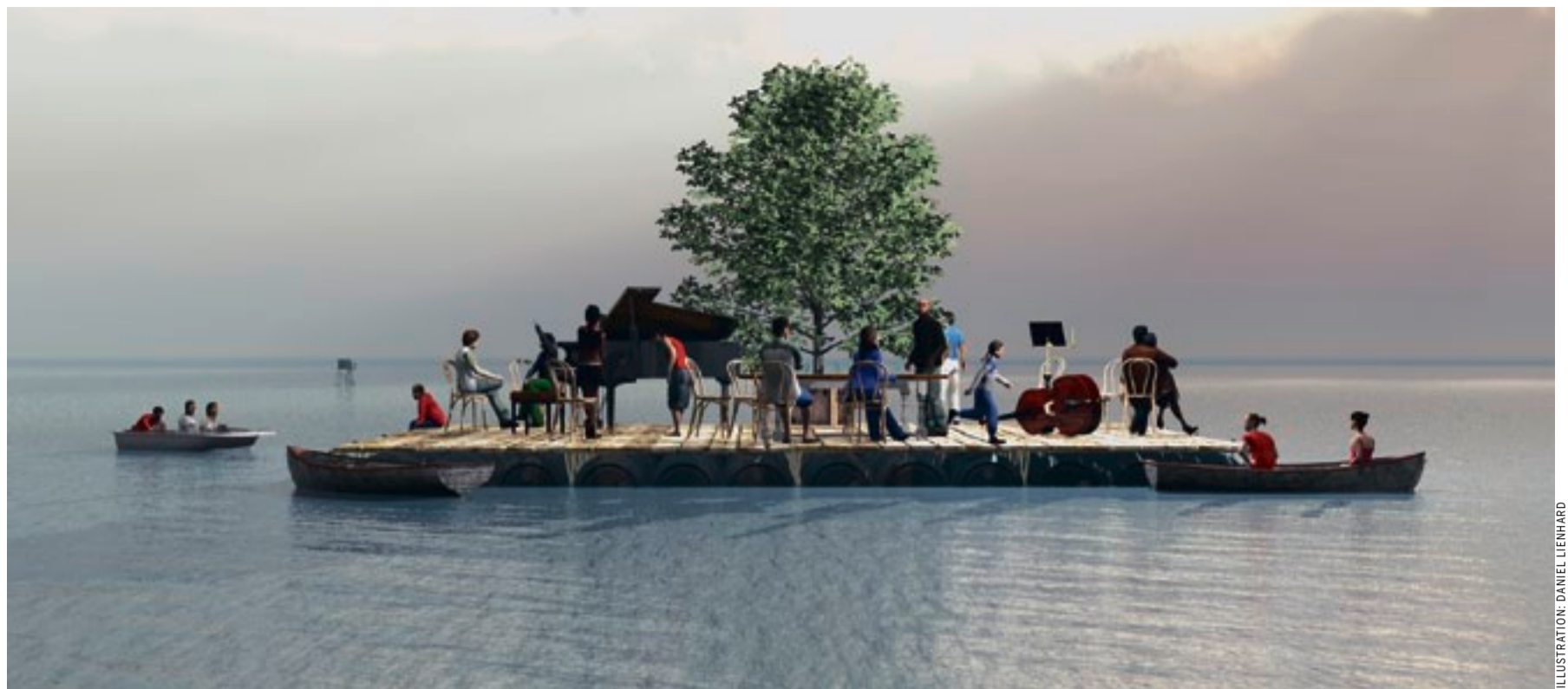
ILLUSTRATION: DANIEL LIENHARD