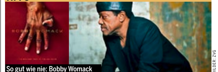
So gut wie nie: Bobby Womack