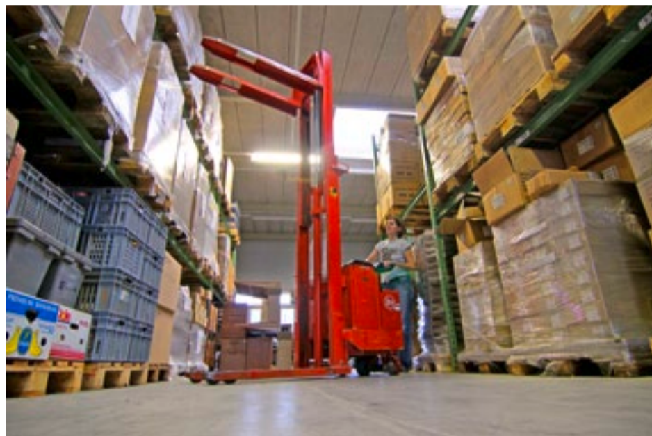
Thirza Jacobi von der Sozialunternehmung Meilestei an der Arbeit im Lager in Wetzikon

NATURALSpenden/ Viele Firmen haben regelmässig grosse Mengen von Restposten. Die Sozialwerke Sieber stellen solche Waren Kirchgemeinden und sozialen Einrichtungen zur Verfügung.