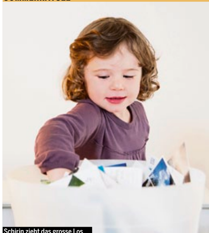
Schirin zieht das grosse Los